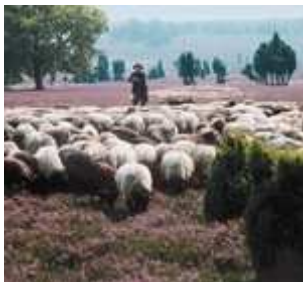
Niedersachsen: Schäfer mit seiner Heidschnuckenherde in der Lüneburger Heide

Die Landwirtschaft nutzt 57 % der Fläche. 21 % der Fläche sind Wald. In der Braunschweig-Hildesheimer Lössbörde werden Weizen und Zuckerrüben angebaut, auf den Geestplatten besonders Roggen, Hafer und Kartoffeln, in den Fluss- und Küstenmarschen herrscht Grünlandwirtschaft mit Viehzucht vor. Gemüse wird besonders zwischen Hannover und Braunschweig und im Emsland angebaut, Gemüse und Obst besonders im Alten Land und im Land Kehdingen . Bedeutend ist die Viehwirtschaft. Der niedersächsische Anteil an der deutschen Erdgasförderung beträgt nahezu 100 %, an der Erdölförderung über 70 %. Die Schwerpunkte der Fördergebiete liegen für Erdgas in den Räumen Emsland, Südoldenburg, Sulingen und Söhlingen, für Erdöl im Emsland und Celle □ Gifhorn. Im Raum Celle □ Hannover werden Stein- und Kalisalze, im Raum Helmstedt Braunkohle abgebaut. Die Industrie ist im südlichen Niedersachsen konzentriert: Eisenerzverhüttung, Eisen- und Stahlverarbeitung im Gebiet Salzgitter □ Peine. Die bedeutendsten Industriezweige sind Fahrzeugbau (Wolfsburg, Emden, Osnabrück, Braunschweig, Hannover, Salzgitter), Maschinenbau (Hannover, Braunschweig-Peine-Salzgitter-Gebiet), Elektrotechnik (Hannover, Südniedersachsen) und Nahrungsmittelindustrie, ferner Textilindustrie (Osnabrück, südliches Emsland), feinmechanisch-optische Industrie (Braunschweig, Göttingen).