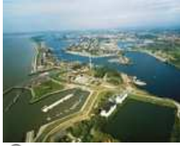
Niedersachsen: Blick auf den Hafen Wilhelmshaven

An der Küste dominieren Schiffbau, chemische und petrochemische Industrie und Fischverarbeitung. Hannover richtete die Weltausstellung EXPO 2000 aus und ist Sitz der größten Industriemesse der Welt und der CeBIT. Der Fremdenverkehr spielt eine große Rolle in den Nordseebädern, der Lüneburger Heide und im Harz. Niedersachsen weist zwei Hauptrichtungen des Durchgangsverkehrs auf: Der West-Ost-Verkehr verläuft v. a. am Nordsaum der Mittelgebirgsschwelle, der Nord-Süd-Verkehr, der von den Nordseehäfen ausgeht, führt v. a. durch das Leinetal. Zur umfangreichen Verkehrsinfrastruktur zählt neben dem Straßennetz und dem Eisenbahnnetz auch ein beachtliches Netz von Binnenwasserstraßen. Dortmund-Ems-Kanal, Elbeseitenkanal, Mittellandkanal und Küstenkanal sind für Europaschiffe (1 350 t) befahrbar. Wichtige Binnenhäfen sind Salzgitter, Emden, Oldenburg (Oldenburg), Brake und Nordenham, die wichtigsten Seehäfen Wilhelmshaven, Brake und Nordenham. Der internationale Flughafen Hannover hat überregionale Bedeutung.