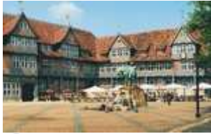
Niedersachsen: Altstadt von Wolfenbüttel

Niedersachsen liegt fast ganz im Bereich der niederdeutschen Sprache; im äußersten Nordwesten spielt Friesisch ( Friesen ) eine Rolle. □ 52,2 % der Bevölkerung gehören den evangelischen Landeskirchen an, 18,2 % der katholischen Kirche. □ Niedersachsen hat (2006) Universitäten in Göttingen, Oldenburg (Oldenburg), Osnabrück, Hannover, Hildesheim, Lüneburg und Vechta, TU in Braunschweig und Clausthal-Zellerfeld, medizinische Hochschule und tierärztliche Hochschule in Hannover, Hochschule für Bildende Künste in Braunschweig, Hochschule für Musik und Theater in Hannover sowie elf Fachhochschulen.