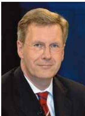
Niedersachsen: Christian Wulff, Ministerpräsident seit 2003

Niedersachsen wurde durch die britische Militärregierung am 1. 11. 1946 aus der ehemaligen preußischen Provinz Hannover und den Ländern Braunschweig, Oldenburg und Schaumburg-Lippe gebildet; 1947 wurden Teile des Landes (Bremerhaven) Bremen angegliedert. 1947–74 war die SPD die stärkste Partei im Landtag (1970–74 absolute Mehrheit), 1977–78 und 1982–86 die CDU (seit 1982 absolute Mehrheit). 1990 wurde die SPD stärkste Partei (Koalition mit den Grünen; 1994–2003 absolute Mehrheit der Mandate), 2003 wieder die CDU (Koalition mit der FDP, fortgesetzt 2008). Ministerpräsidenten: H. W. Kopf (SPD; 1946–55, 1959–61), H. Hellwege (DP, später CDU; 1955–59), G. Diederichs (SPD; 1961–70), A. Kubel (SPD; 1970–76), E. Albrecht (CDU; 1976–90), G. Schröder (SPD; 1990–98); G. Glogowski